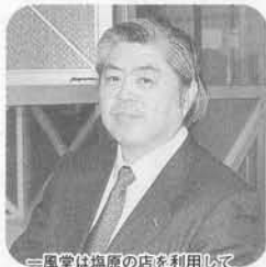
＝風堂は塩原の店を利用して いますよ。とんこつ白いやつ （白丸元味）が好きですね。

*地方の中小企業を対象に「企業ののれんづくり」を提言するデザインプロデューサー・ディレクター